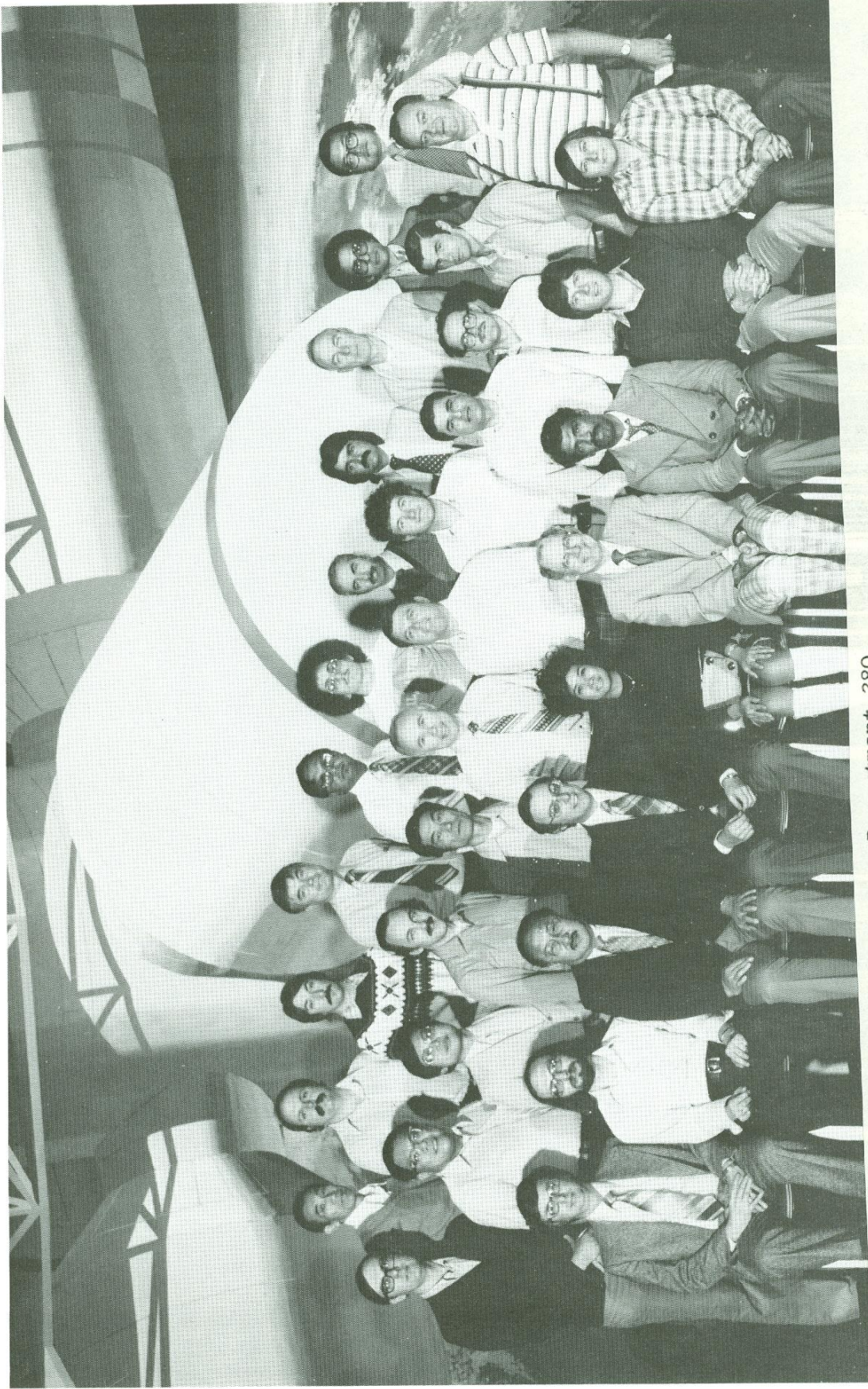
Department 380 STRUCTURES ANALYSIS Groups 202, 203, 204 January, 1979